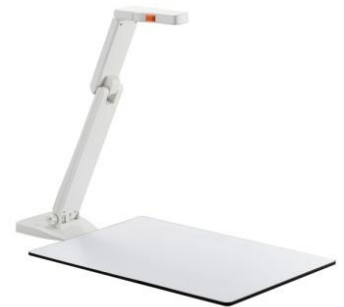
Optional Writing Whiteboard