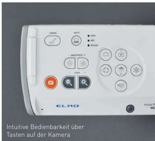
Intuitive Bedienbarkeit über Tasten auf der Kamera